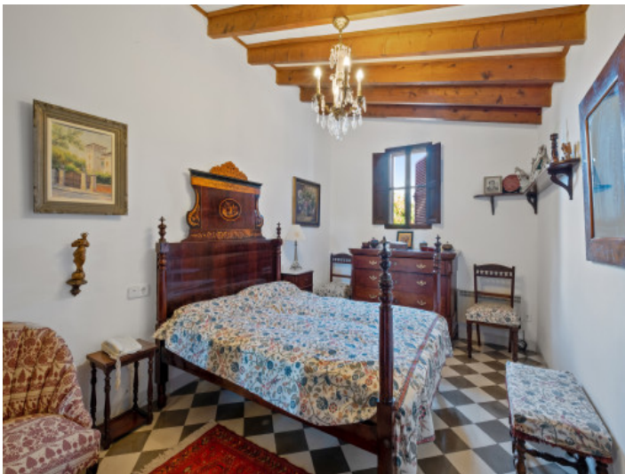
Uno de 11 dormitorios