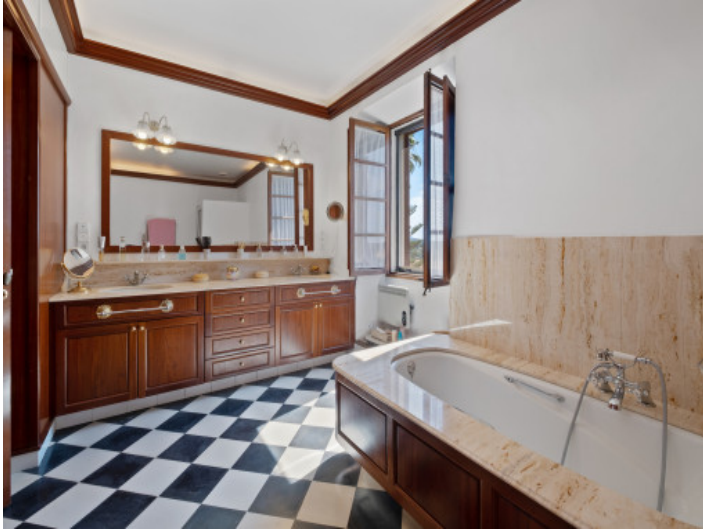
Baño con bañera