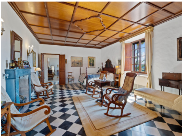
Dormitorio principal grande