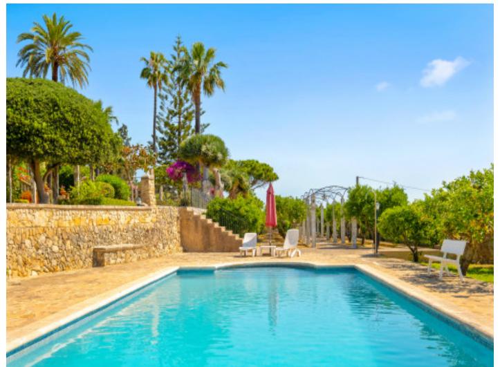
Finca con terreno grande y piscina en Montuiri