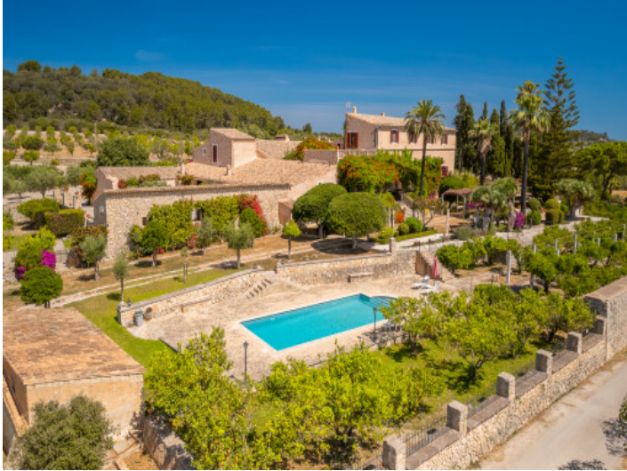
Vista exterior de la finca y piscina