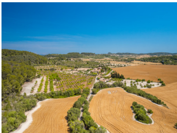
Vista al propiedad