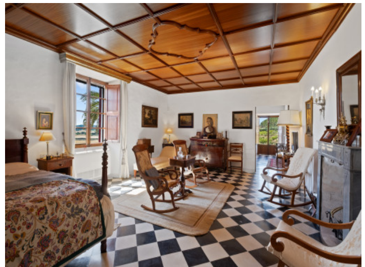
Dormitorio principal grande

Toda la información como mejor se puede saber, salvo por error durante el periodo de venta. Sirva este documento como un informe previo, las bases legales solo serán válidas a través de un contrato de compra acordado ante Notario.