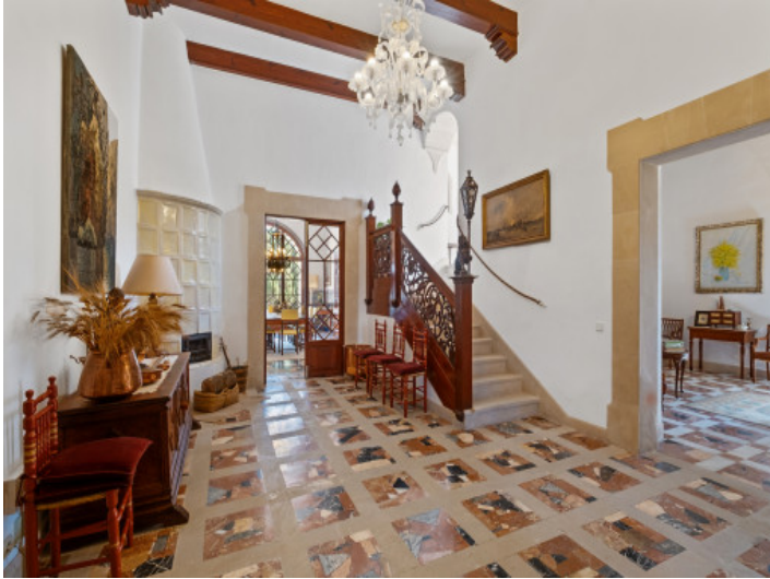
Pasillo y salón