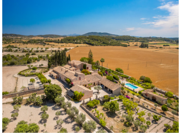
Finca con terreno grande y piscina en Montuiri