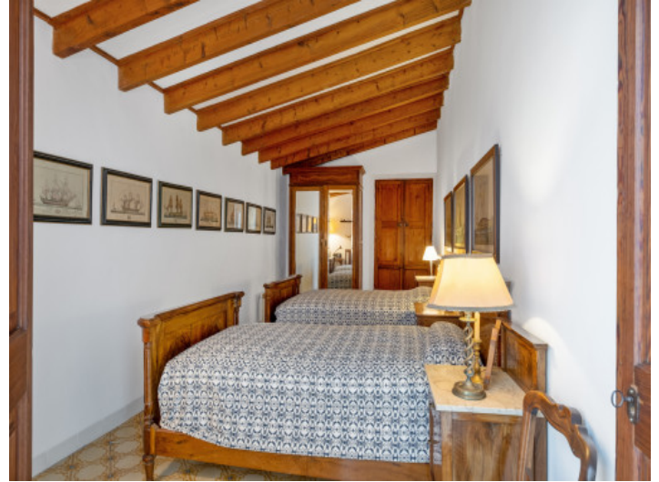
Uno de 11 dormitorios