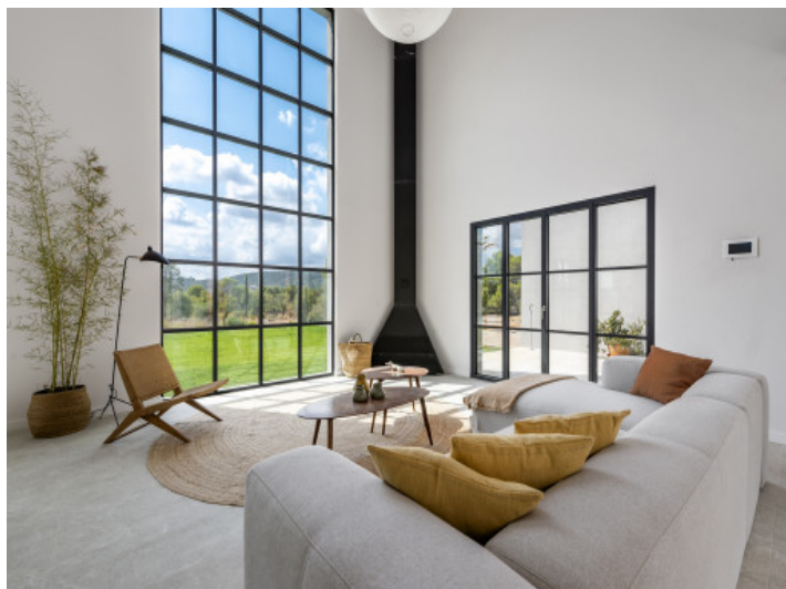
Finca de nueva construcción en Santa Maria