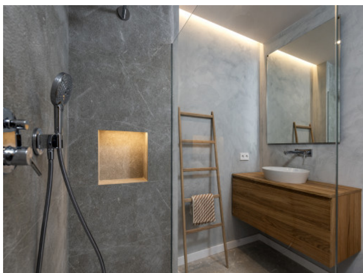
Baño en suite