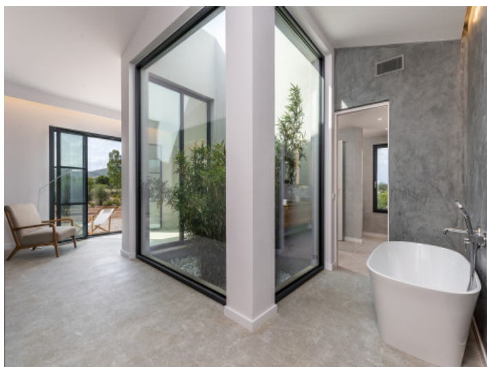
Baño en suite