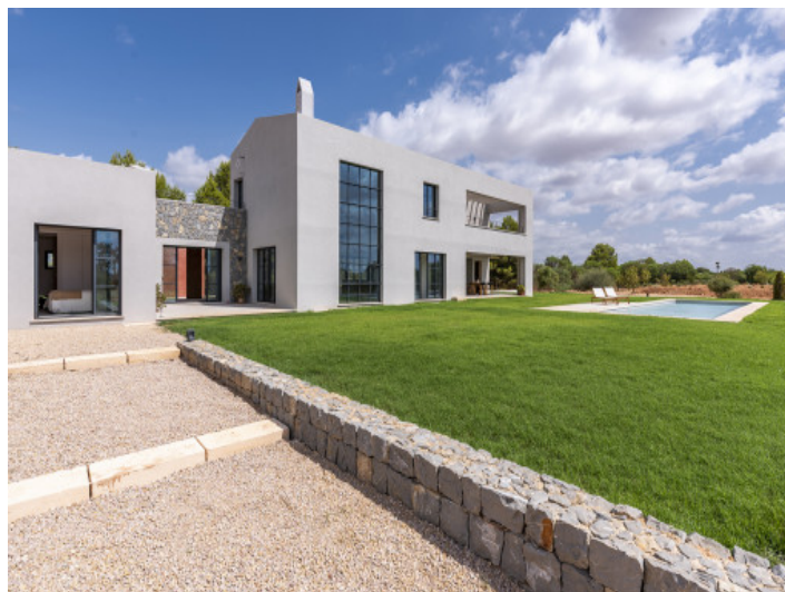
Finca de nueva construcción en Santa Maria