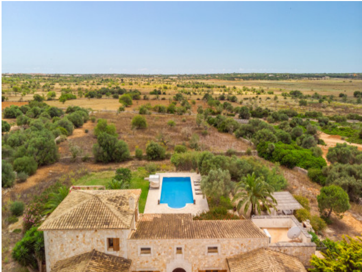
View from above