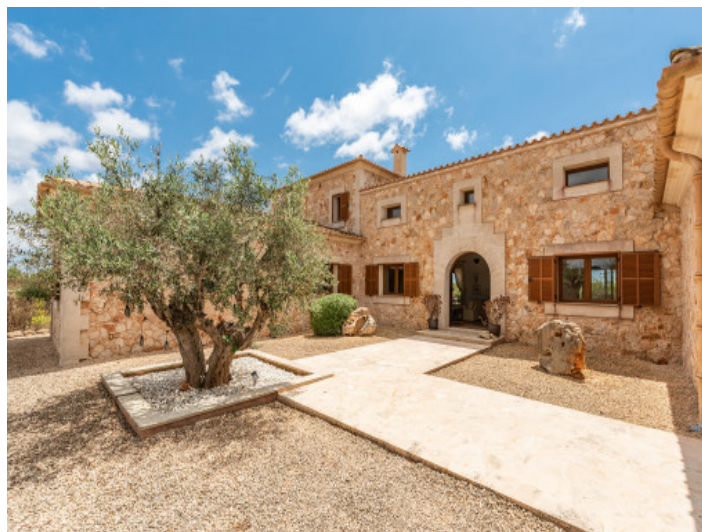
Fantástica finca con piscina, garaje y vistas a la naturaleza en Santanyi