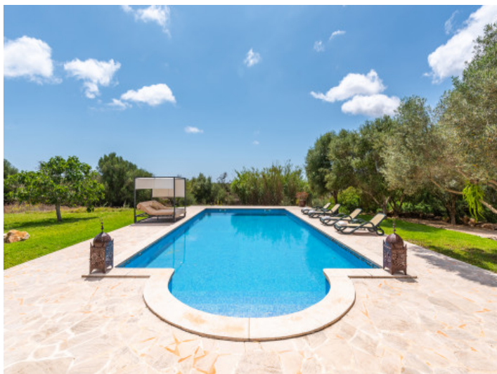
Zona de piscina bien cuidada