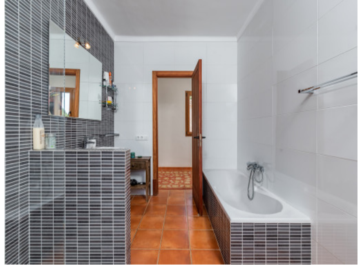
Uno de 4 baños