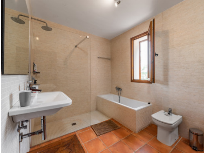
Uno de 4 baños