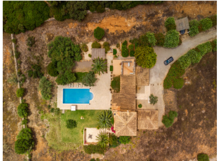
View from above