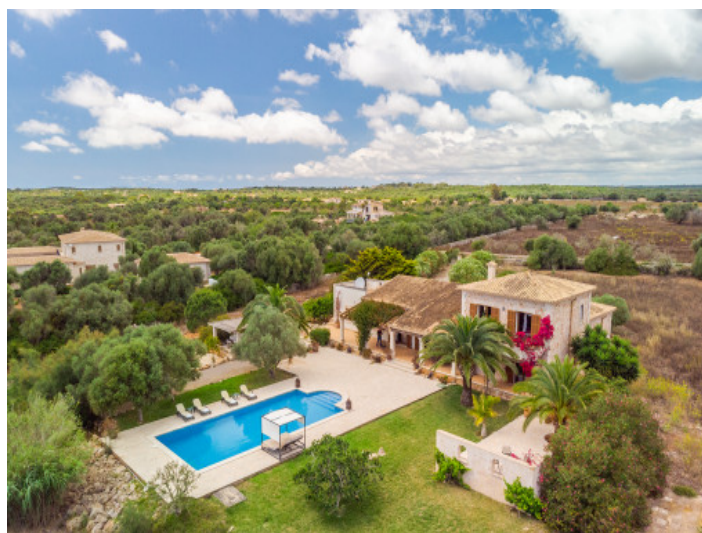
View from above