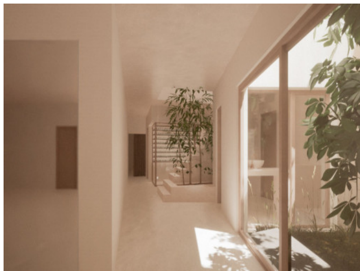
Garden views from the finca