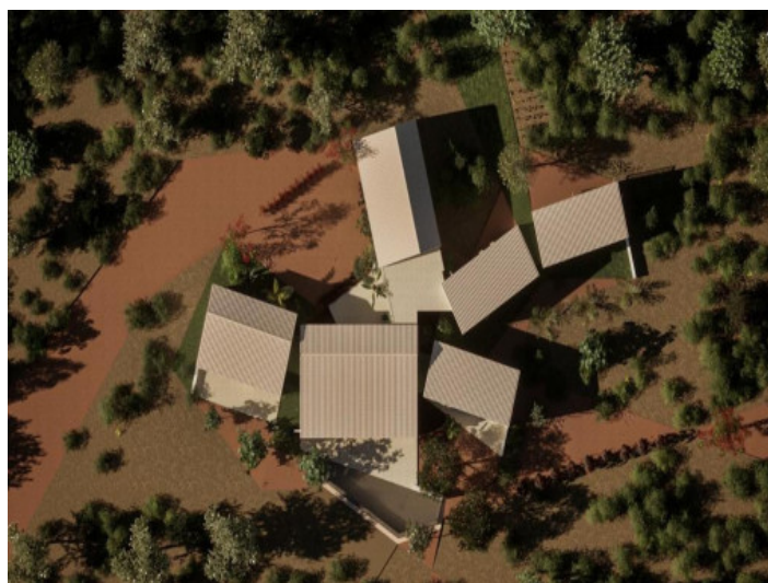
Vista desde arriba