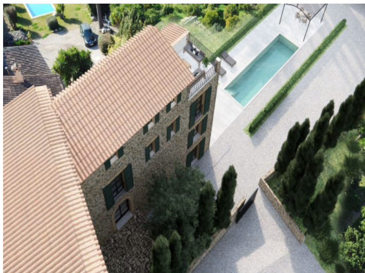
Piscina y área exterior