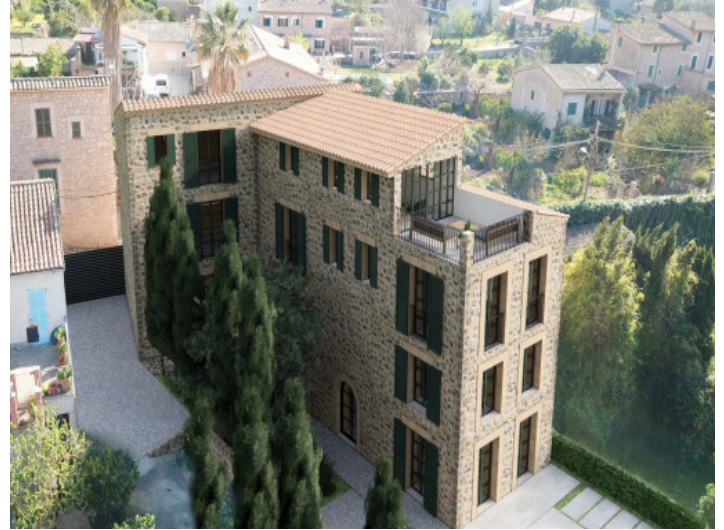
Vista desde arriba