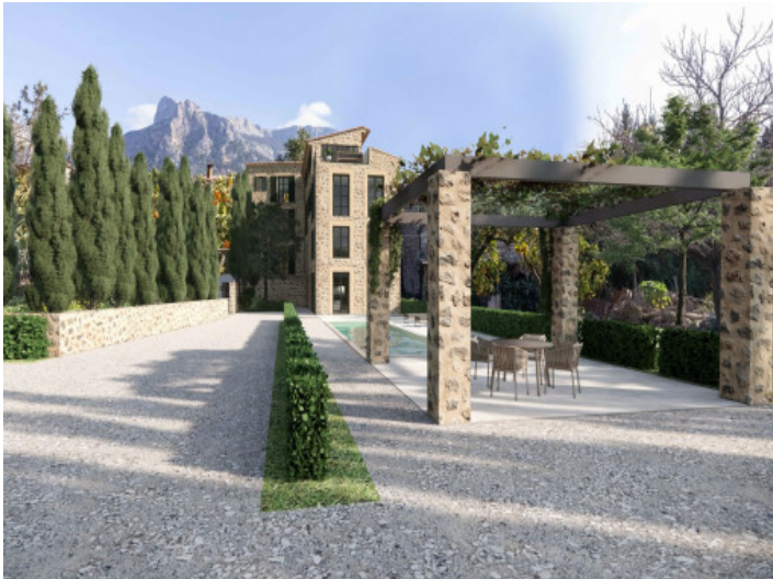
Piscina y área exterior