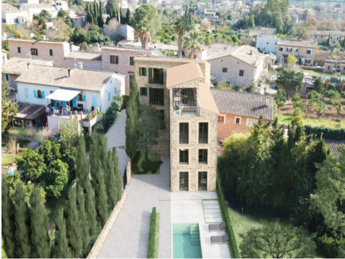
Vista desde arriba