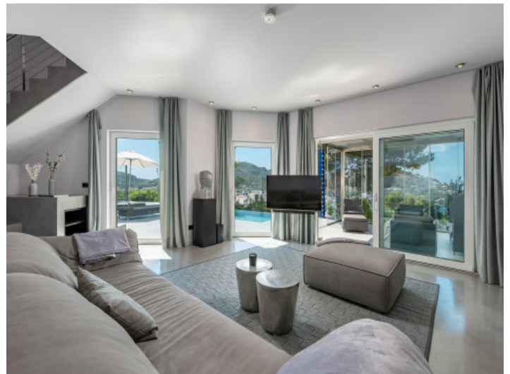
Área de estar