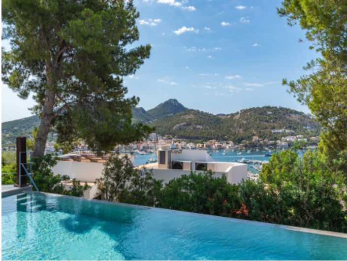
Piscina con vistas al mar