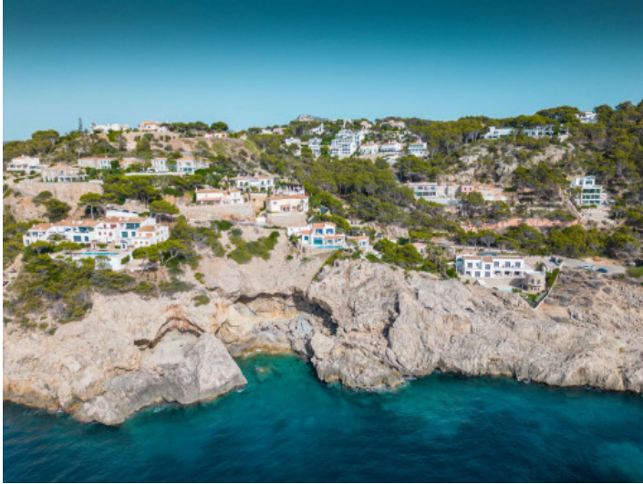
Primera línea del mar