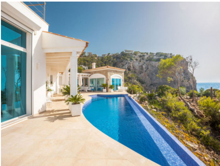
Piscina con vistas al mar