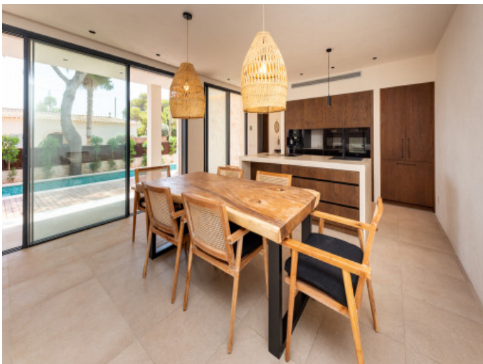
Comedor y cocina