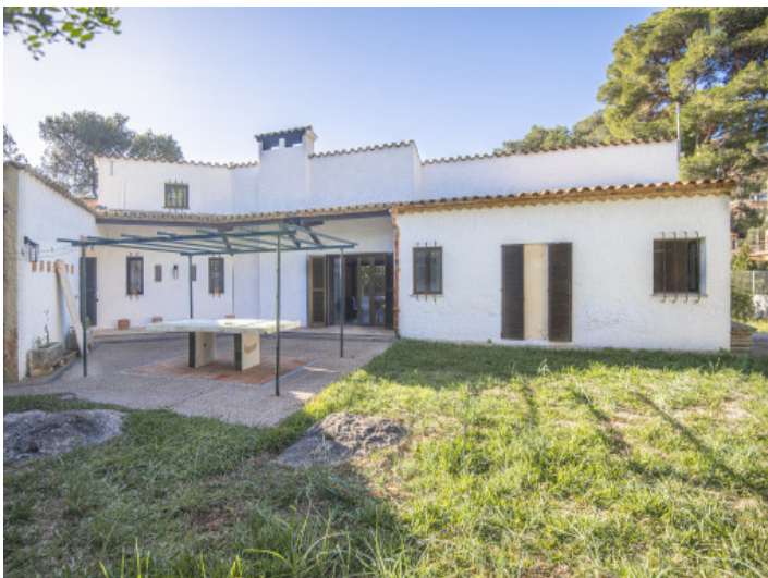
Vista fachada trasera