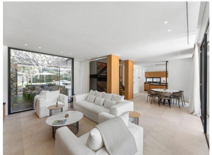
El Área de Salón con Estilo