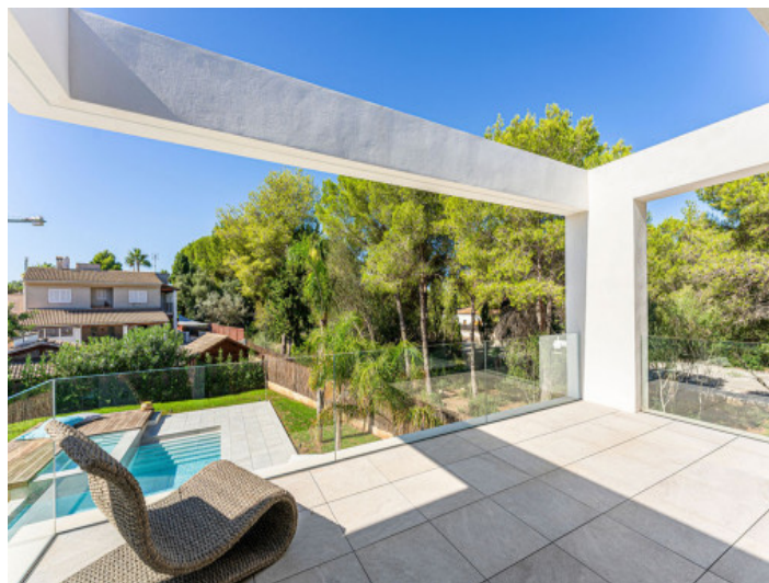
Terraza Abierta al Sol