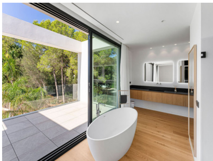
Bañera Independiente en el Dormitorio Principal