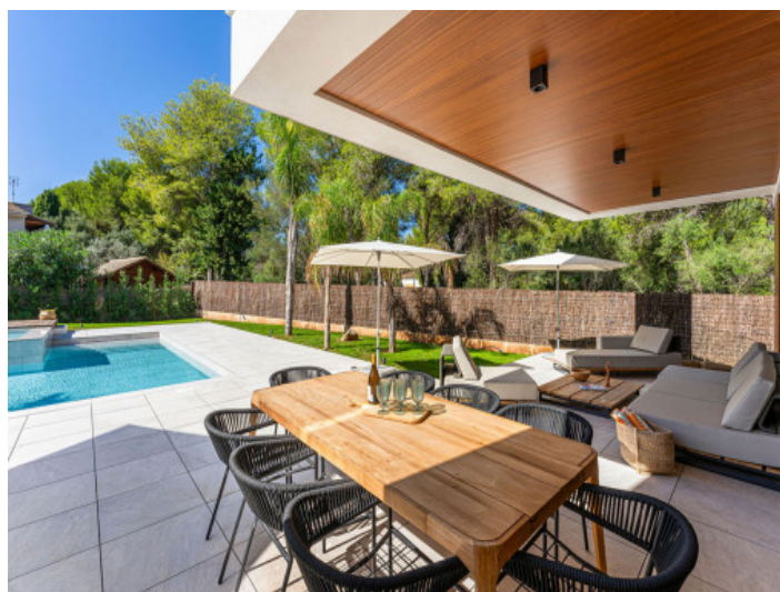
Terraza Cubierta con Vistas a la Piscina