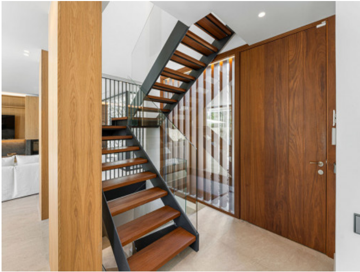
Área de Entrada