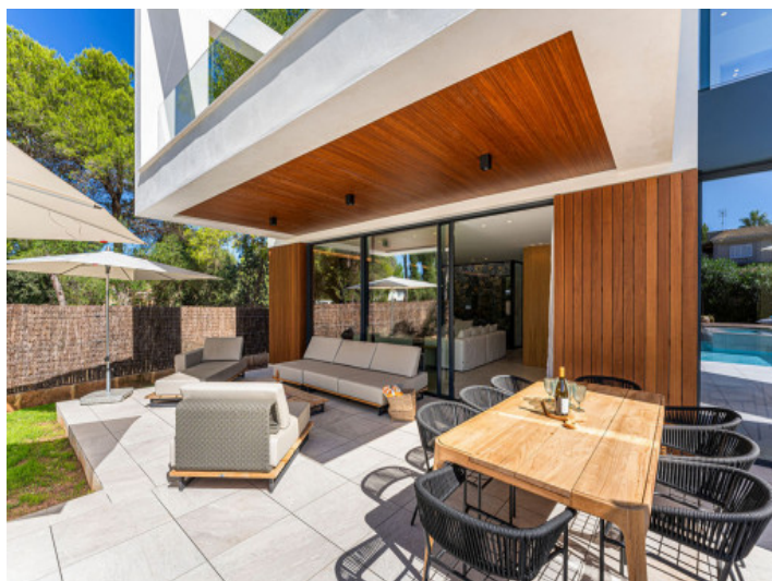
Acceso Directo desde el Salón a la Terraza