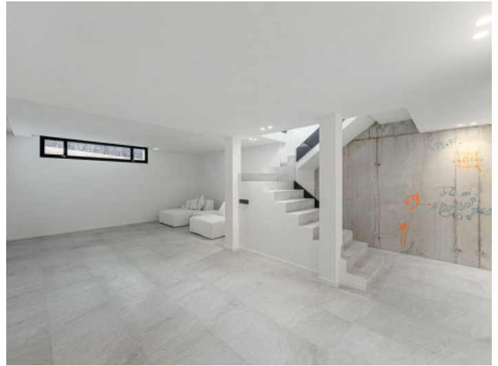
Sótano con Usos Universales