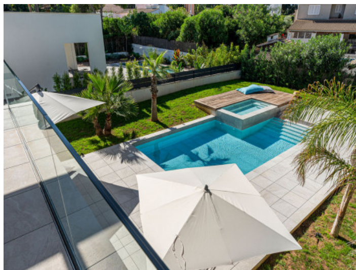
La Piscina Incrustada en un Jardín Bien Cuidado

Toda la información como mejor se puede saber, salvo por error durante el periodo de venta. Sirva este documento como un informe previo, las bases legales solo serán válidas a través de un contrato de compra acordado ante Notario.