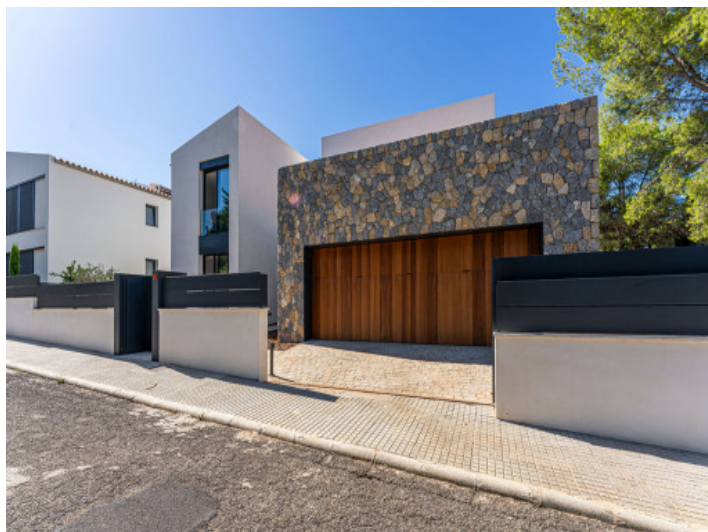
Vista de la Calle de la Villa Moderna