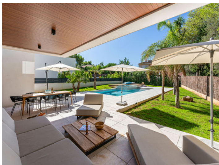
Acceso desde la Terraza al Jardín