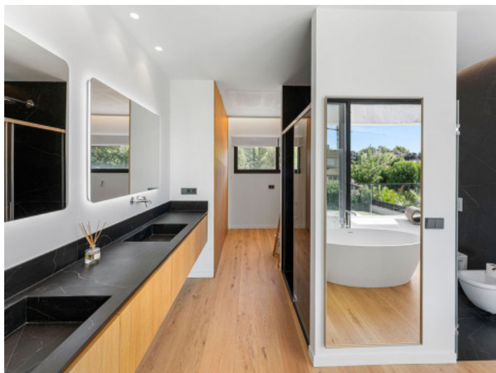
Baño del Dormitorio Principal