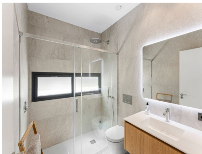
Baño Completamente Equipado