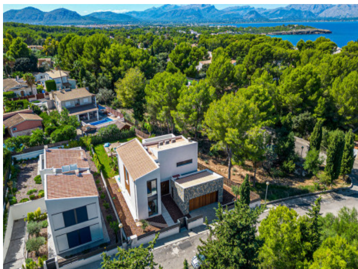
Área de Villas Top