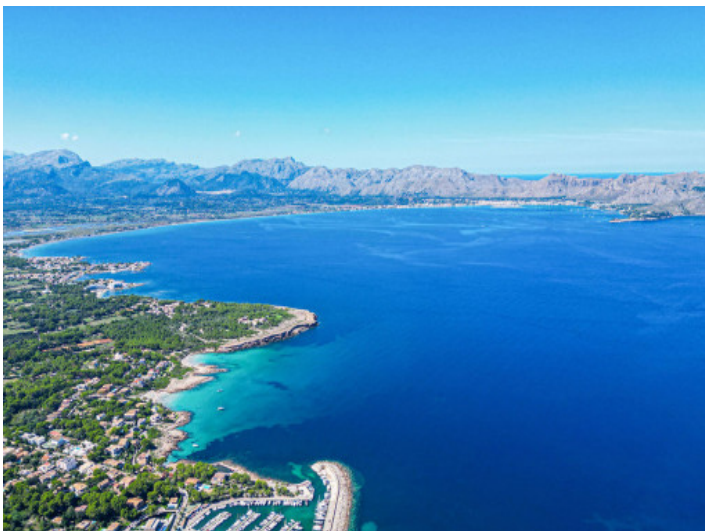
El Puerto Deportivo de Bonaire

Toda la información como mejor se puede saber, salvo por error durante el periodo de venta. Sirva este documento como un informe previo, las bases legales solo serán válidas a través de un contrato de compra acordado ante Notario.