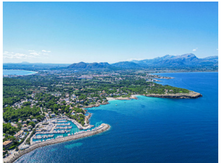
La Bahía de Pollens