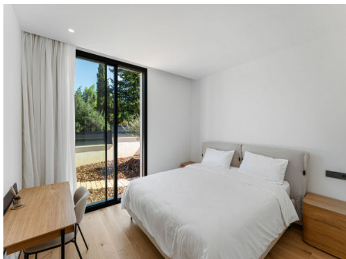
Dormitorio Doble Espacioso

Toda la información como mejor se puede saber, salvo por error durante el periodo de venta. Sirva este documento como un informe previo, las bases legales solo serán válidas a través de un contrato de compra acordado ante Notario.