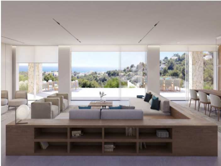
Área de estar