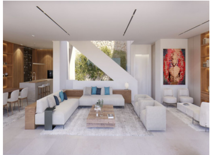
Área de estar