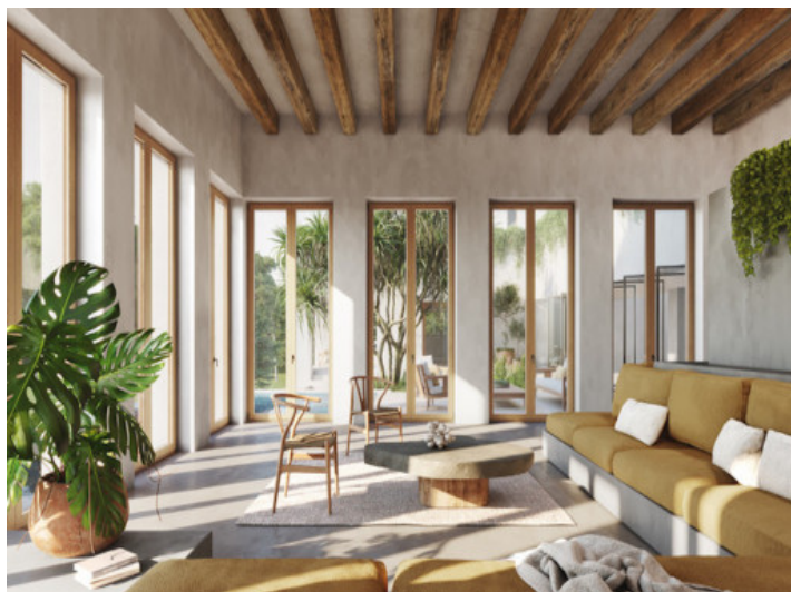
Salón con ventanas panorámicas