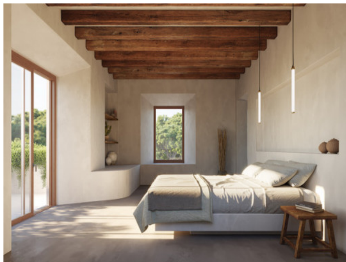
Dormitorio inundado por luz natural