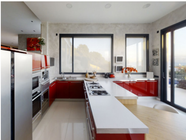
Cocina totalmente equipada