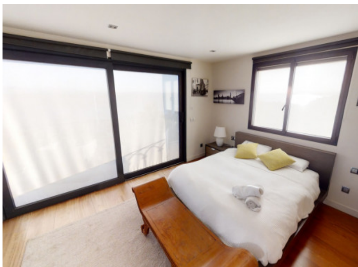
Segundo dormitorio doble en la planta superior