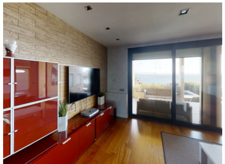
Salón con acceso a la terraza

Toda la información como mejor se puede saber, salvo por error durante el periodo de venta. Sirva este documento como un informe previo, las bases legales solo serán válidas a través de un contrato de compra acordado ante Notario.