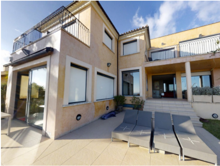
Vista de la fachada de la villa