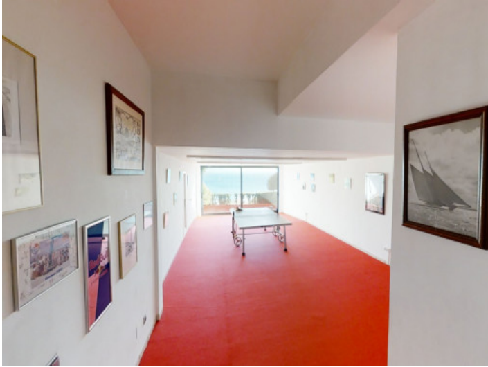
Garaje utilizado actualmente como sala de ocio