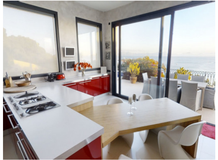
Cocina con zona de desayuno