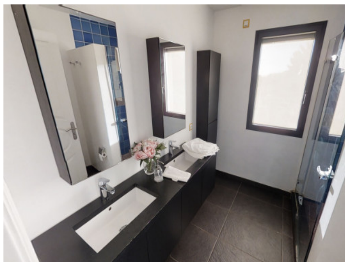
Baño independiente en la planta superior