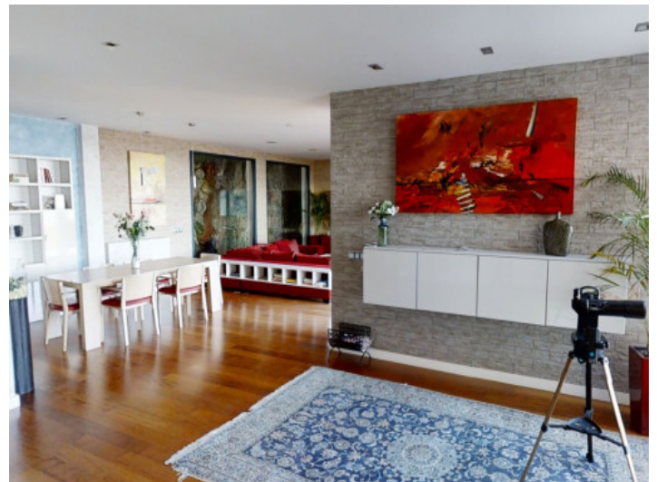
Amplio vestíbulo con espacio para un rincón de descanso