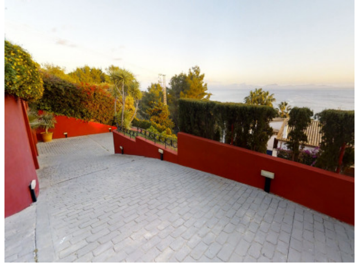
Entrada de vehículos y aparcamiento