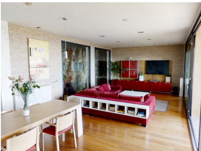
Vista de la zona de comedor y sala de estar