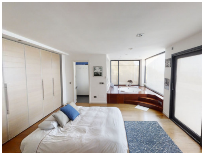
Dormitorio principal con baño en suite