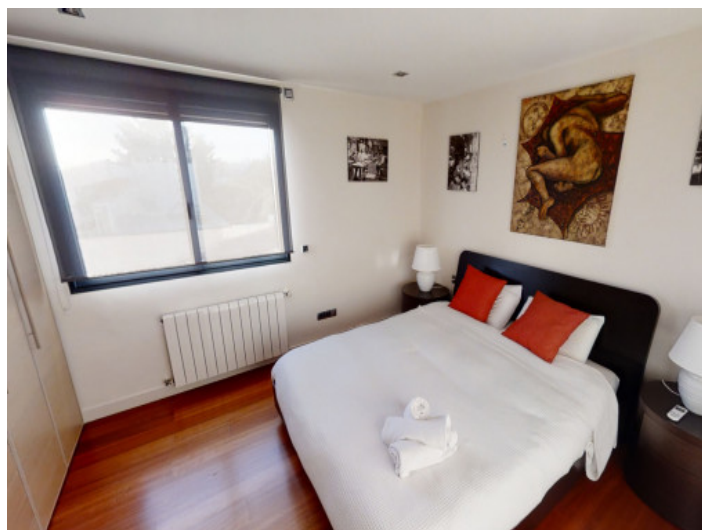
Tercer dormitorio doble en la planta superior

Toda la información como mejor se puede saber, salvo por error durante el periodo de venta. Sirva este documento como un informe previo, las bases legales solo serán válidas a través de un contrato de compra acordado ante Notario.