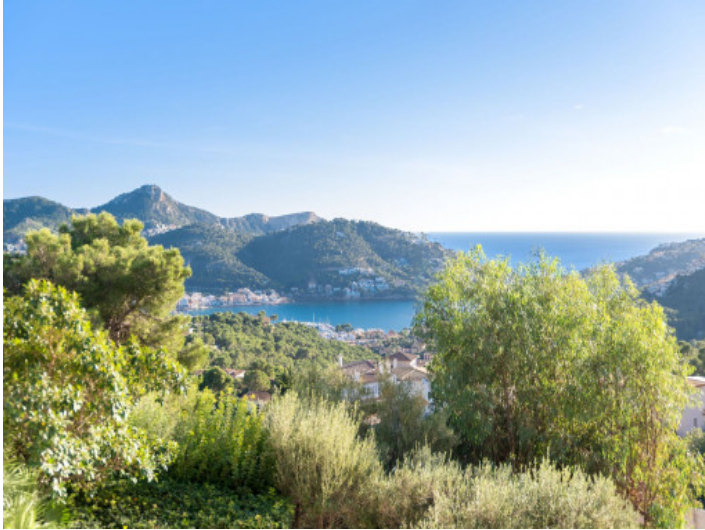
Estupendas vistas al puerto