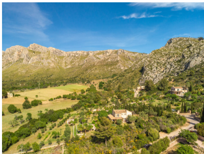
Vista de la propiedad desde arriba

Toda la información como mejor se puede saber, salvo por error durante el periodo de venta. Sirva este documento como un informe previo, las bases legales solo serán validas a traves de un contrato de compra acordado ante Notario.