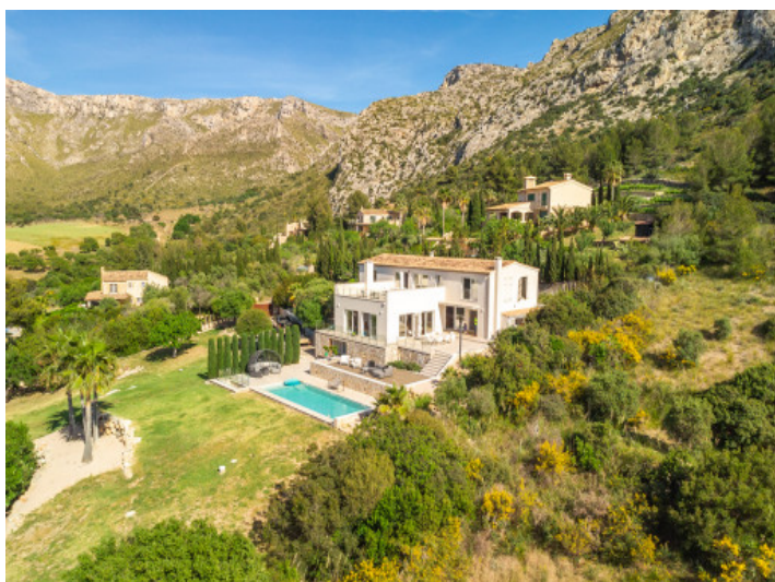
Chalet a vista de pájaro