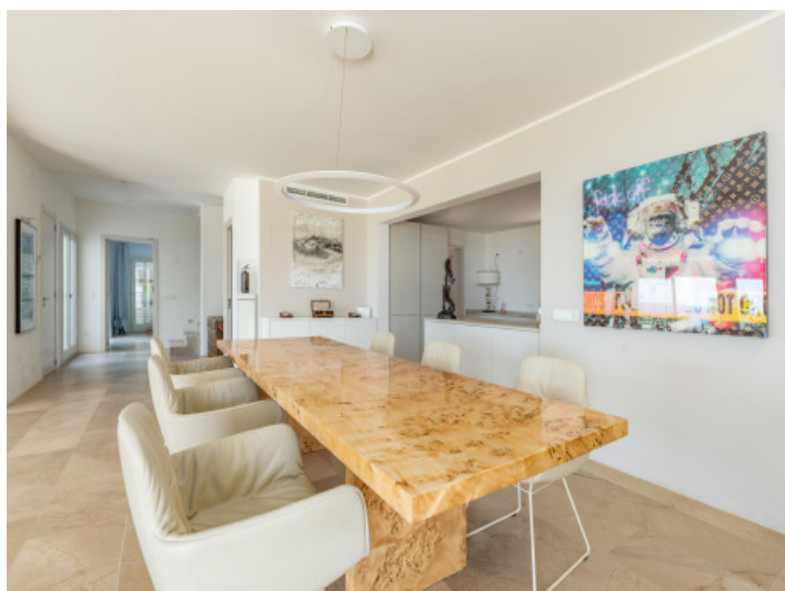
Comedor y cocina