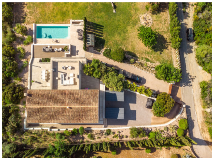
Vista de la propiedad desde arriba