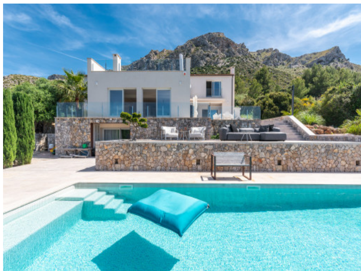
Zona de piscina