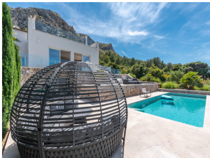
Zona de piscina