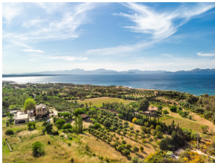
Vistas al mar