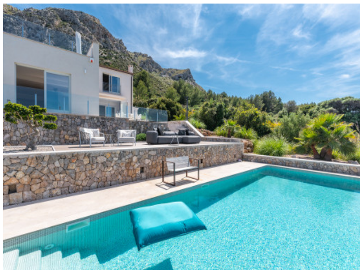
Zona de piscina