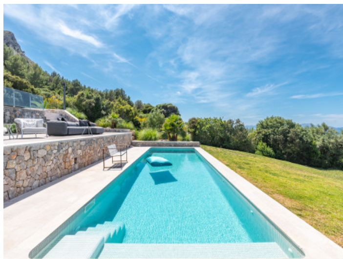
Zona de piscina

Toda la información como mejor se puede saber, salvo por error durante el periodo de venta. Sirva este documento como un informe previo, las bases legales solo serán válidas a través de un contrato de compra acordado ante Notario.