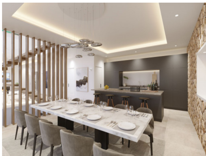
Cocina y comedor