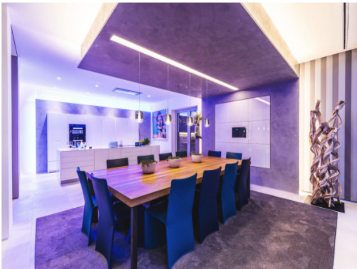
Comedor y cocina