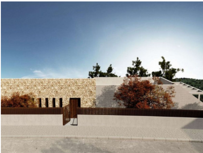
Render vista frontal