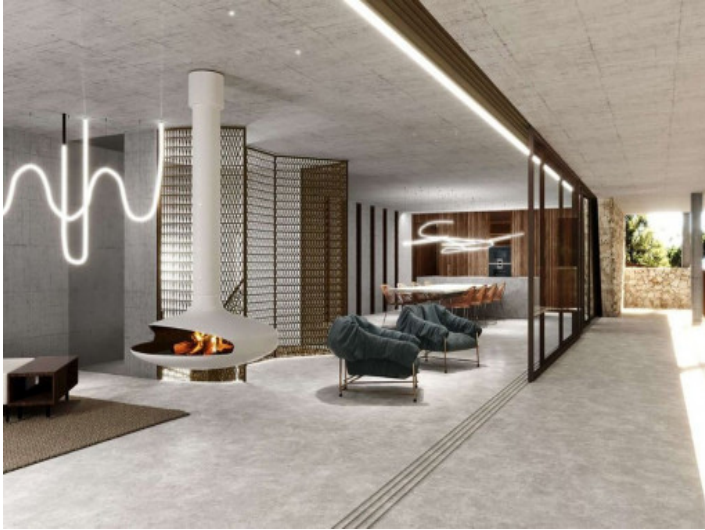
4 dormitorios y 4 baños