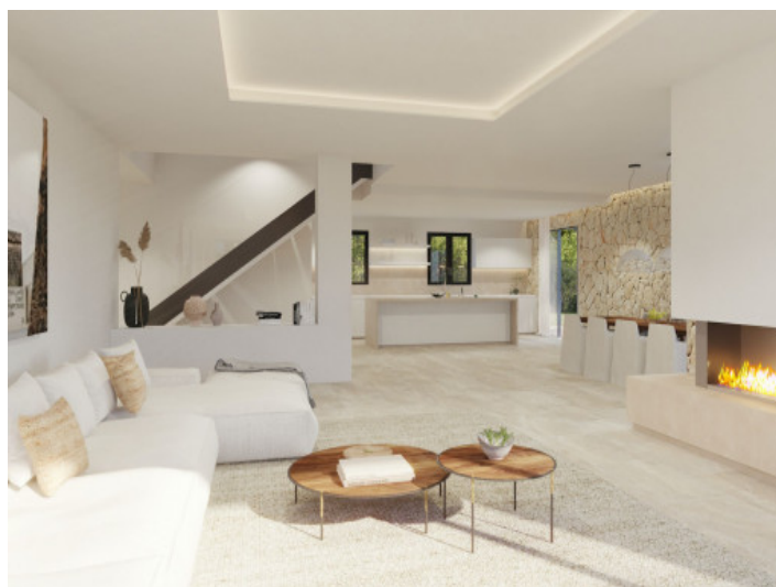
Salón acogedor con chimenea