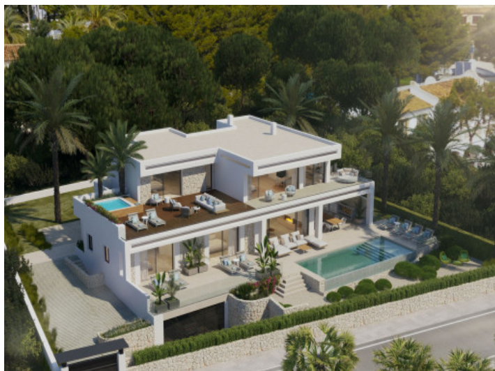
Vista exterior de la villa