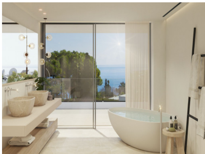
Baño con bañera

Toda la información como mejor se puede saber, salvo por error durante el periodo de venta. Sirva este documento como un informe previo, las bases legales solo serán válidas a través de un contrato de compra acordado ante Notario.