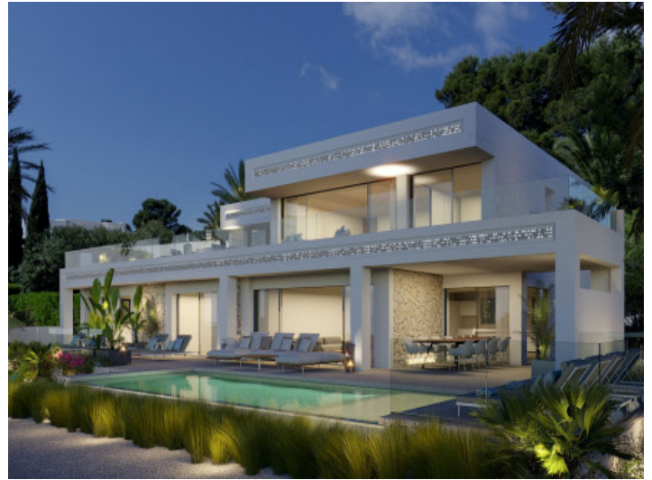
La villa por la noche